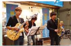
軽快なジャズはもちろん、真夏の果実など歌謡曲も演奏してくれました。

170個、全国の様々な風鈴がチリン♪ カランコロン♪ 三国新道商店街ですっかり名物の「風鈴ストリート」が、最終日の9月28日に「風鈴ストリートライブ」を開催。