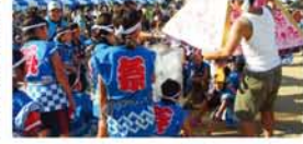
▲田川連合、勢い良すぎて屋根がとれた!でも大丈夫。▶三津屋からは商店街の新キャラクター「みつかもん」も登場。