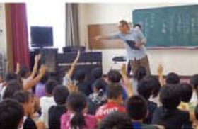
▶最後は自由吟に挑戦。積極的に発表してくれました。▼「ザ・淀川の人?」終了後、声をかけてくれた仲良し2人をパチリ。

淀川区で文化の種まき活動をしている「よどがわ芸術祭実行委員会」が、10月10日、新高小学校5年生のクラスで「キッズ川柳」の出席授業を行いました。