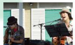
マイキー&ロビンソン (ほた山)

「十三で老若男女が楽しめる音楽の祭りを根付かせたい」と、昨年初めて開催され、260人を動員した「十三ええとこ音楽祭」。2度目の今年は10月13日に、「十三を盛り上げたい」と10組のバンドが集結。来場者数は300人を超え、大成功でした。