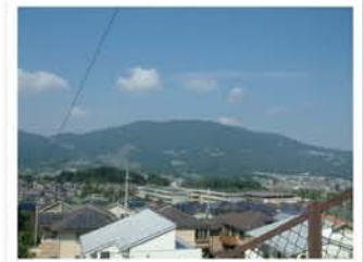
足湯「歓喜乃湯」辺りから生駒山を見る