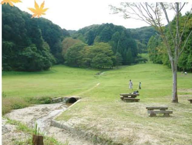
「矢田山遊びの森」の広場