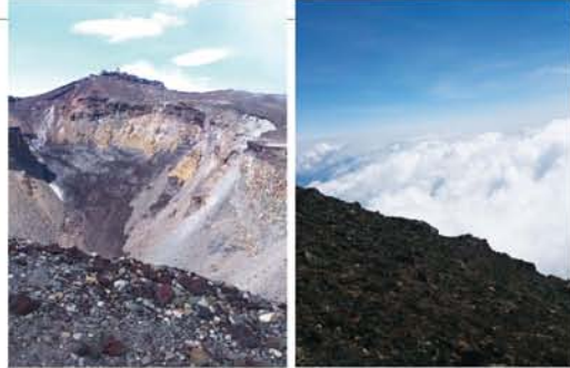
左上から時計まわりに、ご来光→上に見えるのが頂上→目の前に広がる雲海→迫力の噴火口

一言。「お前のイビキこの山小屋の中で一番凄かったで!」自分のイビキがそんなにすごいとはショックでした。私が言うのもなんですが、山小屋に泊まる時は耳栓を忘れずに! 見えているのに遠い頂上 魅力一杯、また来年も 曇り空でご来光を見るまでに時間が掛かりましたが、ご来光を見た時はなんとも言えないパワーを感じました。 その後朝食を済ませて頂上目指して出発。一步一步確実に頂上へ向かって登っていきますが、頂上は見えているのになかなか近くなりません。それでも頂上に確実に向かっていると思うと嬉しくなり、登るペースが上が