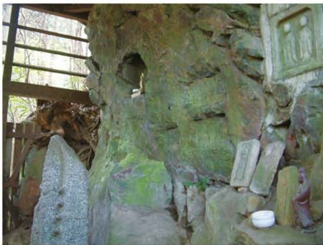
滝寺廃寺の磨崖仏

今回は、近鉄線「南生駒」駅から矢田自然公園の「子どもの森」を散策し、滝寺廃寺の磨崖仏を拝観します。帰りに民族博物館を見学するのもいいでしょう。約8キロ、5時間の初心者コースです。大阪難波から近鉄線で「南生駒」までは、「生駒」で乗り換え約30分です。