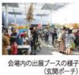
会場内の出展ブースの様子(玄關ポーチ)

◆11月16日(土)17日(日) 9時30分～16時30分 大阪市立自然史博物館(長居公園内 地下鉄/JR・長居駅) 関西文化の日のため入館無料 【問】06-6697-6221 http://www.omnh.net/np0/fes/2013/