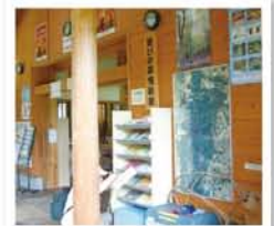
子どもの森管理事務所