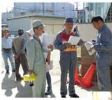
校内の安全確認の後、開設。▶避難所では、情報収集、食糧物資の調達、炊き出し、トイレの管理、救護など各部に分かれて運営。

練を実施。煙中歩行体験は7mほどでしたが、「全然前が見えへん!」と皆さんタジタジ。