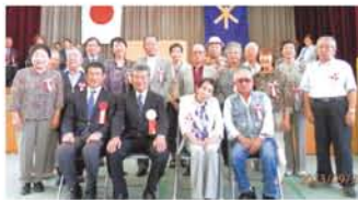
田川では20組のご夫婦が金婚式を迎えました。

大阪市立田川幼稚園の可愛い演技に続いて、田川小学校6年生の有志による元気なダンスでオープニング! 9月28日、田川小学校で田川敬老会が開かれました。「今年は1056名の方が敬老の日を迎えました。できるだけこの