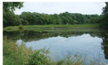
「矢田自然公園子どもの森」の上池で遊ぶアヒル