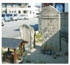
近鉄南生駒駅前の十三仏の碑