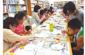
▲次々と力作を生むお母さん。 「何かに没頭できるっていいですね！」▼「ママは何色が好きなん？」こちらは仲良く話しながら