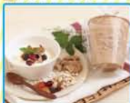
ハーブと木の葉のグラノーラ作り