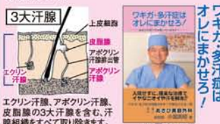
ワキガ・多汗症はオレにまかせろ！

電磁波や照射系の減臭治療ではいずれ再発し治療を繰り返す懸念があります。ワキガの元の汗腺を切除することのみが完治できる方法です。