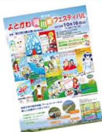
今年の本番は、10月16日です。

毎年秋に開いている「よどがわ河川敷フェスティバル」。今年は、「本番に向けて交流を深めよう」と、8月28日に木川南公園でイベントを開催します。