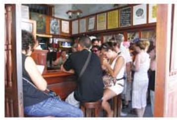
外国人観光客らに人気のバリエ市内のバー。

すでに今年8月中旬、キューバ革命直後に日本を訪れたゲバラが立ち寄った「ヒロシマ」からスタートし、ハバナの医学生時代を中心にしたロケが進められているようだ。公開は2人の没後50年となる来年秋。