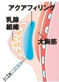
乳腺下、乳腺周囲に注入します。施術時間は1時間程度です。

「アクアファイリングが特に優れている点は、他のバストに比べて、アクアファイリングが特に優れている点は、他のバストに比べて、