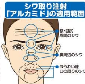
シワ取り注射「アルカミド」の適用範囲

「アクアファイリングが特に優れている点は、他のバストに比べて、アクアファイリングが特に優れている点は、他のバストに比べて、