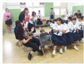
ハンブルクでも人気のアイス取りゲーム。 洋菜に会わせてちょっぴりハード。