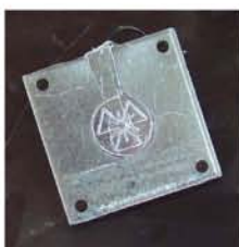
この後、型から外して、丁寧に磨いていきます。「今年は、ほとんど失敗しませんでした。中でも自信のバッジを納品しました」

技術研究所は、技能検定への挑戦やエコーランカー(電池自動車)の製作など各種競技会への