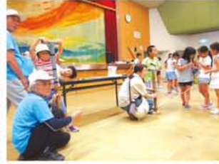
◀ホールの端から端まで飛ぶ「ストローロケット」に子どもたちは大興奮。 ▼「風船ホバークラフト」は、風船から漏れる空気で浮かび、机を動き回ります。フェスティバル直前まで部品を調整していた役員の皆様、お疲れさまでした。

淀川区子ども会連合協議会は8月14日、区民センターで「夏休み子どもフェスティバル」を開催。子どもと大人約200人が集まりました。毎年いろんな工