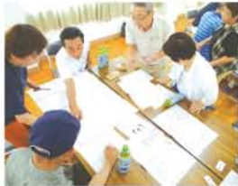
「夏の晴れたとても暑い日」の設定でHUGゲーム。「90歳の人なら、1階がええ」「授乳中なら、赤ちゃんが泣くから体育館より教室がいい」初めて参加する人も積極的に関与の意見を出しました。

加島地域活動協議会は7月31日、加島小で避難所運営ゲームHUG（ハグ）を実施し、防災リーダー、美津島中のジュニア防災リーダーら約65名が参加しました。