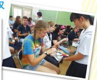
東三国地域の人たちからの手ぬぐいなどの お土産に、うれしそう。野中地域の女性会 は手作りの昼食を振る舞い、大好評でした。

大阪市と、姉妹都市であるドイツ・ハンブルク市が、両市の特徴である「河川」や「中高生による防災活動」に視点を合わせた交流を始めて、6年。