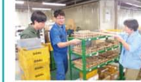
株式会社ゴール 三津屋北2-16-6

えげつない暑さの中、皆さまいかがお過ごしでしょうか? 今月も鍵作り一筋、100年以上の歴史を誇る株式会社ゴールさん。鍵の種類によっては、見た目は同じように見えても、何億何兆通りの鍵を作り出せるということ! また、複数の違う種類のドアの鍵を、一つの鍵で開けてしまえるマスターキーのシステムの技術は圧巻! 業界でもトップクラスの会社なのです! そんな素晴らしい鍵作りの様子を見学させてもらい、それはもう細かいったらありゃしない。ミリ単位の部品の組み立てなど、女性の職人さん