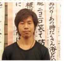
原簿賠償関西訴訟の報告会会場に掲示された、川柳「避難者あるある575」の前で。

私は、大学ではサッカー観戦と練習の毎日、本もろくに読まないような成績の悪い学生でしたが、失恋を機に、アルゼンチンに留学しました。しかし、1年の予定だった交換留学は半年で切り上げ、同じ市内の国立大学に半年留学し、独裁期に起きた人道に反する罪を問う裁判の傍聴や授業の聴講や新聞を読む毎日。その後は多文化と多言語についての修士課程を2年履行したんですが、単位はほとんど取れないまま。けれど、たくさん運動や人との出会いが魅力でした。警官による貧困層への令状なしの不当逮捕に対してのデモであったり、モンサントへの抗議、高校のカリキュラム変更に対しての学校占拠やデモ、中絶の非犯罪化を求めたり、femicide(女性殺し)に対してのアピールなど、毎日がお祭りのような音楽と踊りで溢れるような社会運動。そうした運動に関わる人たちとマテ茶を交換しながら飲み、自分の存在を確かめる。そこにはマイノリティーとして生きながら、共有できる喜びや悲しみがありました。