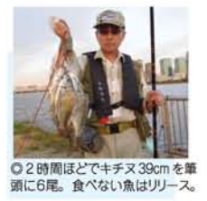
◎2時間ほどでキチヌ39cmを筆 頭に6尾。食べない魚はリリース。

大会では四国で準優勝。夏季大会 では第2シードで松山聖陵に残念 ながら敗れました。 (木川東・コスモスさん) ★勝っても、負けても、おばあち ゃんは感激。嗚呼、これぞ青春、 甥っ子がタイガースFCの2軍 選手の野球教室イベントに立派選 手先日参加してきました♪指導して もらった横田選手&板山選手、一 軍を自指してガンバレー! (木川西・NMさん) ★若虎よ、打て、守れ、イテマエ〜! 6月下旬、十三のタケタ製菓付 近で母が転倒。近所の方や帰宅 途中の方に119番していただき 助かりました。母は手術を終え ただ今リハビリ中です。淀川はい いばかりで感謝しています。 (西淡路・USさん) ★ちよつとの段差でスッテンコロ リン！おばあちゃん、寝たきりに ならんようにリハビリ頑張って!